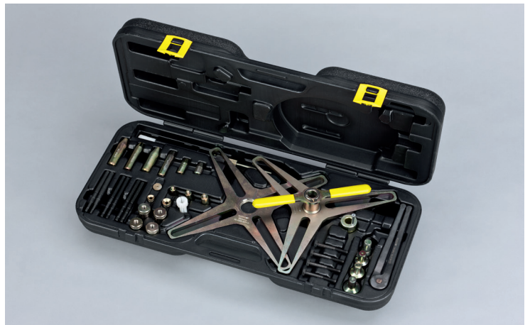
Bild 2: Das Spezialwerkzeug 400 0237 10 ermöglicht eine professionelle Kupplungsreparatur

Angaben des Fahrzeugherstellers beachten!