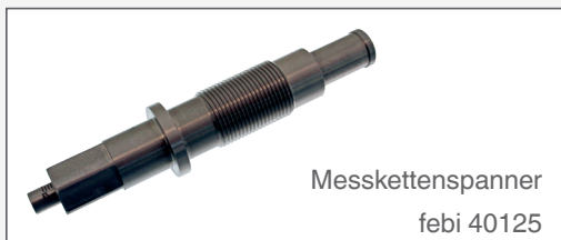
Messkettenspanner febi 40125