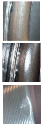
Lagerschäden auf Grund von Einbaufehlern

Die Kraft darf nur auf den Lageraußenring ausgeübt werden, um das Lager nicht zu beschädigen.