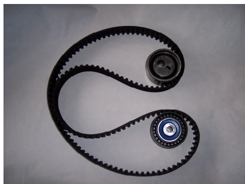
SKF kits - VKMA 03244 / 03247-Inhalt neu

© SKF ist eine eingetragene Marke der SKF Gruppe.