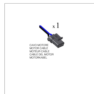
CAVO MOTORE MOTOR CABLE MOTOR CABLE CABLE DEL MOTOR MOTORKABEL

Moteur cable / Motorkabel Cavo motore / Cable del motor