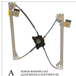
A POWER WINDOW LEFT ALZACRISTALLI ELETTRICO SX

Lève-vitre de remplacement / Ersatz-Fensterheber Alzacristalli di ricambio / Elevavinas de recambio