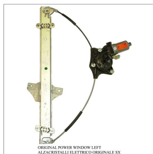
ORIGINAL POWER WINDOW LEFT ALZACRISTALLI ELETTRICI ORIGINALE SX

Lève-vitre d'origine / Original-Fensterheber Alzacristalli originale / Elevavinas original