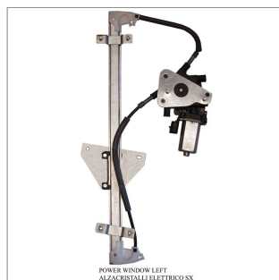
POWER WINDOW LEFT ALZACRISTALLI ELETTRICI SX

Lève-vitre de remplacement / Ersatz-Fensterheber Alzacristalli di ricambio / Elevavinas de recambio