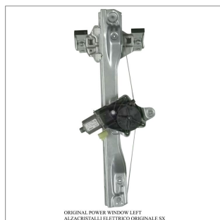
ORIGINAL POWER WINDOW LEFT ALZACRISTALLI ELETTRICI ORIGINALI SX

Lève-vitre d'origine / Original-Fensterheber Alzacristalli originale / Elevavinas original