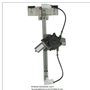
POWER WINDOW LEFT ALZACRISTALLI ELETTRICI SX

Lève-vitre de remplacement / Ersatz-Fensterheber Alzacristalli di ricambio / Elevavinas de recambio