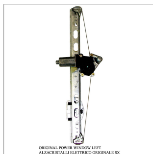
ORIGINAL POWER WINDOW LEFT ALZACRISTALLI ELETTRICI ORIGINALE SX

Lève-vitre d'origine / Original-Fensterheber Alzacristalli originale / Elevavinas original