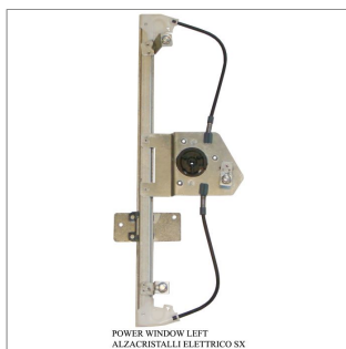
POWER WINDOW LIFT ALZACRISTALLI ELETTRICO SX

Lève-vitre de remplacement / Ersatz-Fensterheber Alzacristalli di ricambio / Elevavinas de recambio