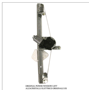
ORIGINAL POWER WINDOW LIFT ALZACRISTALLI ELETTRICO ORIGINALE SX

Lève-vitre d'origine / Original-Fensterheber Alzacristalli originale / Elevavinas original