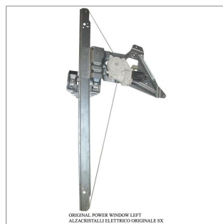
ORIGINAL POWER WINDOW LEFT ALZACRISTALLI ELETTRICI ORIGINALE SX

Lève-vitre d'origine / Original-Fensterheber Alzacristalli originale / Elevavinas original