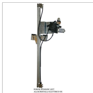
POWER WINDOW LEFT ALZACRISTALLI ELETTRICI SX

Lève-vitre de remplacement / Ersatz-Fensterheber Alzacristalli di ricambio / Elevavinas de recambio