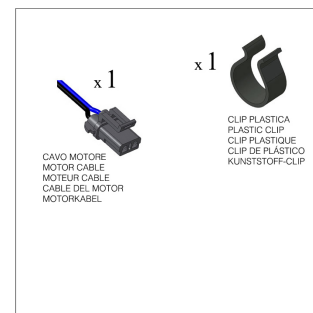
x 1 CAVO MOTORE MOTOR CABLE MOTEUR CABLE CABLE DEL MOTOR MOTORKABEL

Moteur cable / Motorkabel Cavo motore / Cable del motor